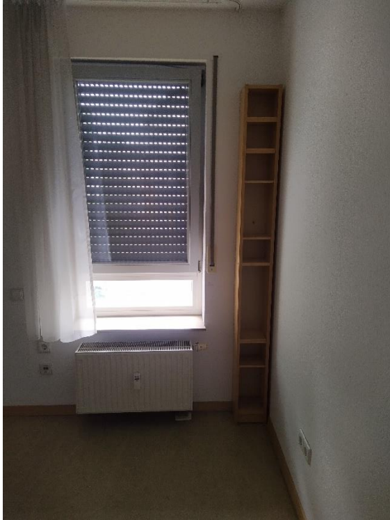
Blick ins Schlafzimmer

Die Möbelstücke auf den Bildern werden nicht mitvermietet.