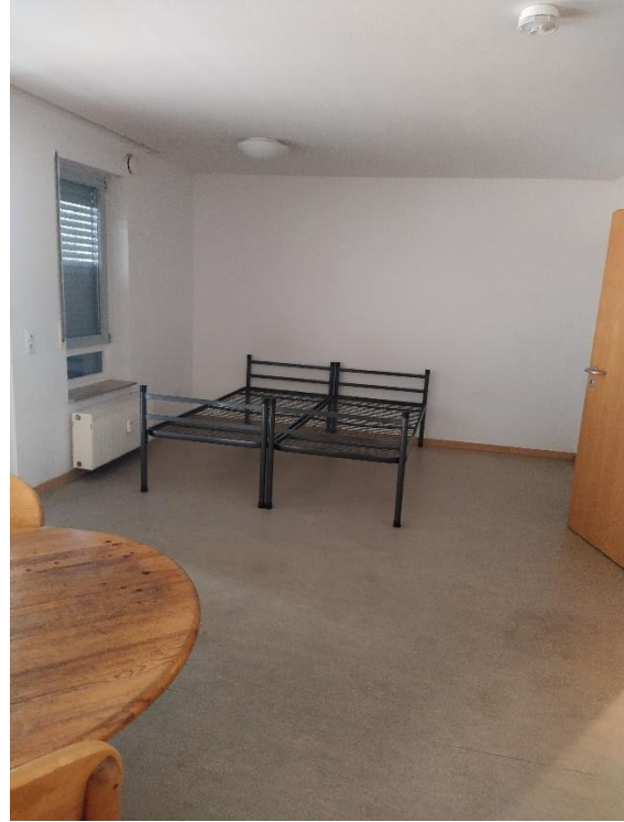
Blick ins Wohn-/Esszimmer